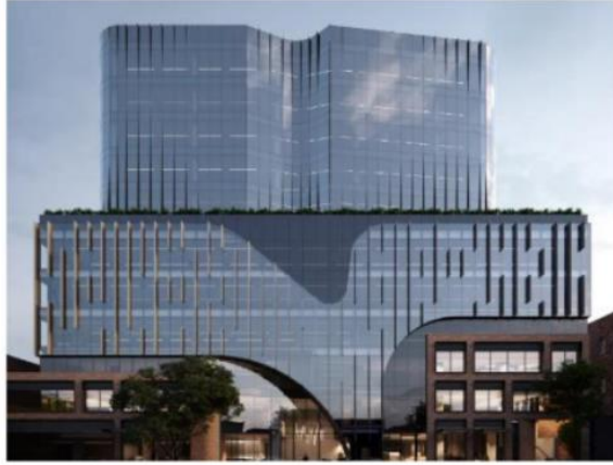
88 Laurens Street, Melbourne Norte Buildcorp