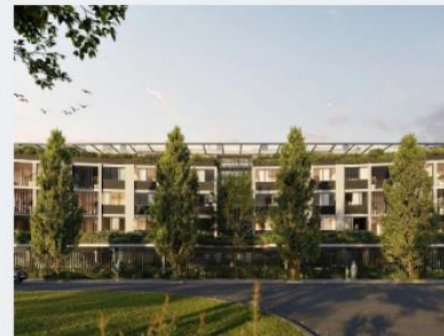
Ferny Grove Central, Brisbane