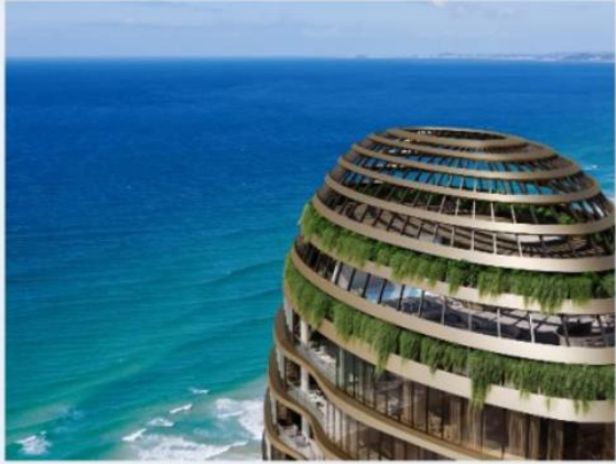
Royale, Costa Dorada