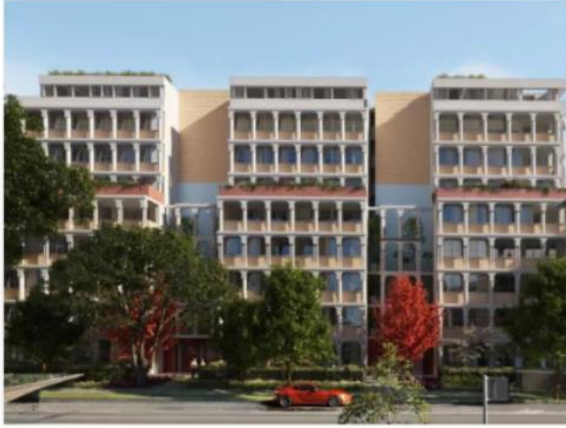
Los Rothschild, Rosebery Deicorp