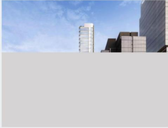
130 Lt Collins Street, Melbourne