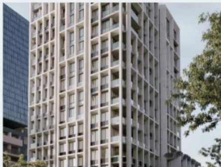
Chatswood, Nueva Gales del Sur 1