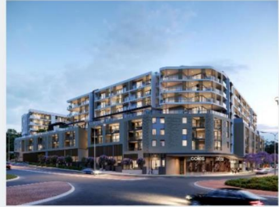
Barrio de Shenton, Perth