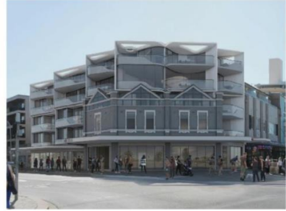
Desfile de Campbell, Bondi Grupo de Propiedad Rebelde