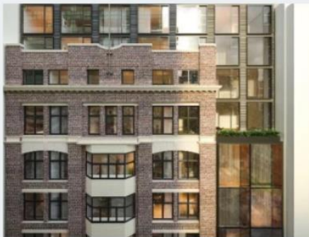
Ace Hotel, Sídney